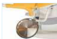
Лоток из нержавеющей стали для инструментов на поворотном кронштейне