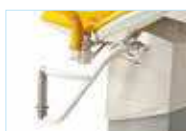
Держатели для кольпоскопов