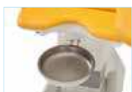
Лоток из нержавеющей стали, большой

Полный список принадлежностей и аксессуаров на сайте www.gracie.eu