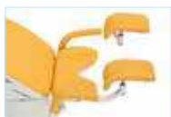
Опоры ног по Геппелю