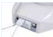
Панель с розетками